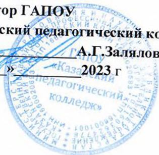
График защиты выпускных квалификационных работ 341 группы специальности 44.02.01 Дошкольное образование за 2022-2023 учебный год