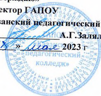
График защиты выпускных квалификационных работ 343 группы специальности 44.02.01 Дошкольное образование за 2022-2023 учебный год