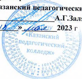
График защиты выпускных квалификационных работ 342 группы специальности 44.02.01 Дошкольное образование за 2022-2023 учебный год